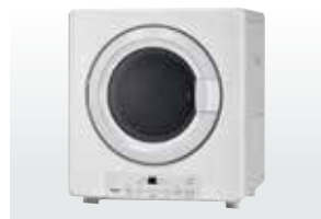
※掲載の写真は全て参考写真及びイメージとなります。