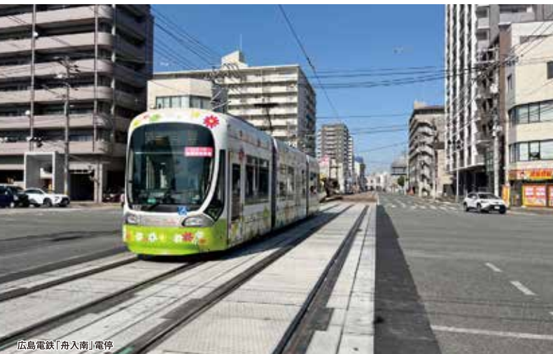
広島電鉄「舟入南」電停